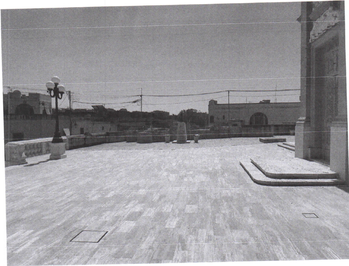
Photo 3 - Existing Building roof higher than open space level.